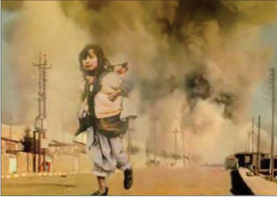
(۱۶ى ئادارا ۱۹۸۸) ل دەمى تۆپ بارانكرنا ھەلەپچە

دژوارترین تۆپ بارانكرنا كىمىياوى ل دەم ژمىر (۵.۲۰) ئىقارى يا ۱۶ى ئادارى دەستپىكر، ھەتا بەرى سىپىدەھىيا رۇژا ۱۷ى ئادارى، (۱۴) جاران فروكا ب بەردەوامى باژىر تۆپ بارانكر.