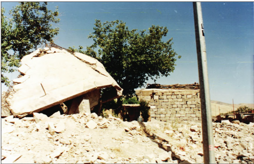
(ویرانکرنا (کافلکرنا) گوندین کوردستانی ل دهمی ئەنفالی)

ئهگهری زوریا هژمارا گرتی و بهرزهکریین گهرمیان، فهدگهریته بۆ هندای کو پاریزگههی سلیمانیی دگهل قائیمقامی چهچهمال ب ریکا مستهشارین کورد پڕوپاکنده بهلافکرن، کو حکومهت ههر خیزانهکی دی بۆ (۳۰۰) مهترین دوجاری یین ئهردی دگهل (قهترین ئافاکرنی) (سلفة العقار) دهته ئاکنجیین گوندان. ئەفی زی وهکر، کو ئەو خهک ئارام ببیت و نهرهفن، لهورا ئەف هژمارا زور هاتنه دهستهسهرکرن.