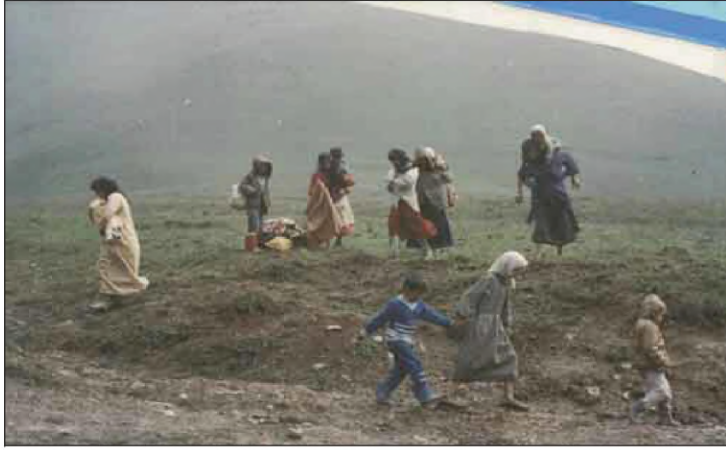
دهرئێخستنا کوردا ژ واری باب و باپیرا

پشتی رێکهفتنایا جهزائیر و شکهستنا شوڤشا ئهیلولێ، دهستی حکومهتا عیراقتی یی شهکری بوو، بو پتر بجه ئینانا سیاسهتا عهرهبی کرن و راگواستنا کوردان، بهلی فی جاری لدویف نهخشهیهکی پلان بو هاتبوو دارێژتن و هاته ئهنجامدان، نه بتنی وان دهقهڕین فرهنهتهوه، بهلکی فی جاری ژ دهقهڕین کورد ناکنجی شهگرتن، راگواستن بو هندهک جهین دیارکری، کو بهعسیا ب ناف کربوون (کوندی ههفچهرخ)، بهلی ب راستی ئوردگاین ب زوری بوون. و ژبلی وان ژمارین مهزنین کورد، کو بو دهقهڕین باشووری عیراقتی هاتینه راگواستن ب تایبهتی ههردوو باژێڕین (ناصریه و دیوانیه) سالآ ١٩٧٥ پتر ژ (٢٠٠ هزار) کورد ل کوردستانی بهرهف دهقهڕین باشووری عیراقتی راگواستن ... ل ههیفا یازدی ١٩٧٥ کۆمهلا گهڵین هیرش لیتری ل ئەلمانیا - گویتنگن، دگهلا کۆمهلا مافین مروۆفی ل هولهندا، راگههاند ژمارا راگواستنا گههسته (٢٠٠٠٠٠) هزار کهسا و سهدا و سازده گوند هاتنه وێرانکرن.