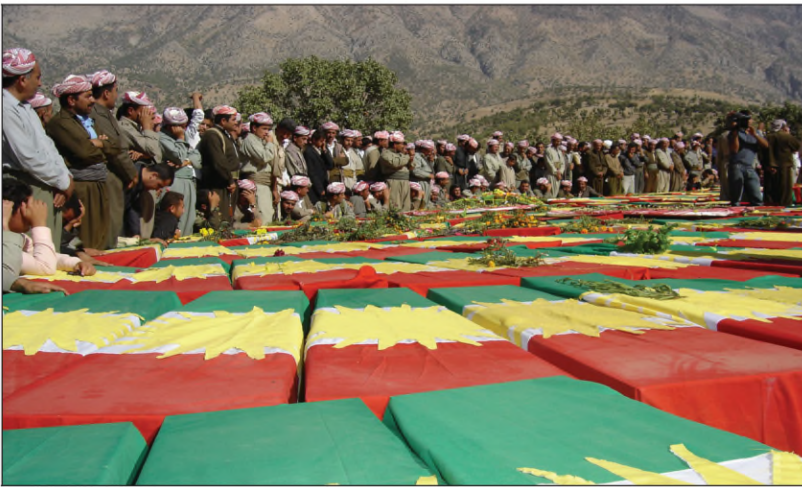
پۆره سمی دووباره فه شارتن ب ساخی بن ئاخکریین بارزانی ل کوردستانا بارزان

بارزانی ب شیوازین جودا جودا ب ساخی بن ئاخ کرن، ل دویف راسپاردین ریقه بهرئ ئاساییشا گشتی ل دهسپیکا هه یفا ته باخی ل سالآ ۱۹۸۳ز فهرمانا سیداره دانئ بسهر پشکه کی ژوان ب جه ئینا و (۱۶) دۆز بو (۶۶۷) شهش سه د و شیست و ههفت که سان ریگخست و حوکه می سیداره دانئ ل سهر دانا و پشکین دی ژی ب شیوازین جورا و جوړ ل (بوسه یه) ل باشووری رۆژئافیئ عیراقئ ب ساخی بن ئاخکرن. پشتی کهفتنا رژیمی ل سالآ ۲۰۰۳ز، ل هه یفا چریا ئیکی ل سالآ ۲۰۰۵ز ب ریوره سمه کی هه ژیدا ته رمی (۵۱۳) پینچ سه د و سیزده که سان کول گۆرین ب کوم ل بیابانا (بوسه یه) ب ساخی بن ئاخکربوون، فه گهراندنه فه ل سهرواری باب و باپیران ل نئزیک بارزان دووباره هاتنه فه شارتن.