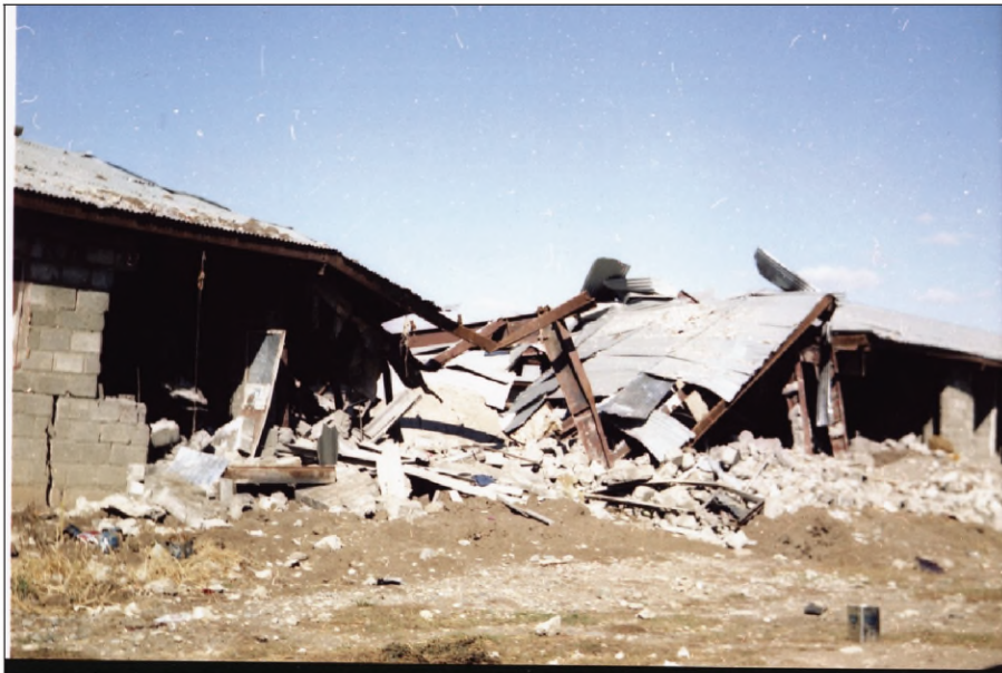
شوونوارین توپ بارانکرنا ئوردوگایی زیوه ژ لایی فروکین جه نگیین عیراقی

پشتی ریککهفتناما جه زائیر کو دناقبه را شاهئ ئیرانی و حکومتا عیراقی ل سالآ ۱۹۷۵ز هاتیه ئیمزاکرن دژی بزافا گه لی کورد بوو نه گه ری شکه ستنا وی بزاقی. حکومتا عیراقی ئەف دهلیشه ب دهرهت زانی و کهفته گیانی گه لی کورد ب گشتی، بارزانی ژی پشکهک بوون کهفتینه بهرفان هیرشین نه مرؤفانه. پشتی سالآ ۱۹۷۵ز پروسا راگواستنئ بهرفهه تر کر و هندهک ژ وان بهرف ئیرانی چوون و هندهکین دی ژی فه گه ریانه ناف کوردستانئ.