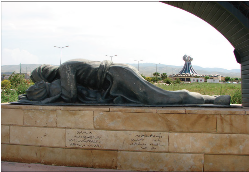
په یکهري عومەري خاور و مۆنۆمېنتی شههیدین ههله پچه

رۆژ ب رۆژ بكارئینانا ئەفی چهكی ترسناك دزیدهبوونیدابوو، دقۇناغین ئەنفالاندا گەههسته گوپیتكا بكارئینانی، رژیمی بیی گیرووبوون هەر بهرهفانیهك یان ئاستهنگهك ل چهكی هاتبا بهرسنگی سوپایی رژیمی ب چهكی کیمیاوی چارهسهر دکر ئەگهري فی ژى بو بیدهنکرنا کۆمه لگههی نیف دهولهتی و بیکهسیا گهلی کورد و قهدهربوونا وی ل دهقهرهکا دابریدا قهدهگریته قه.