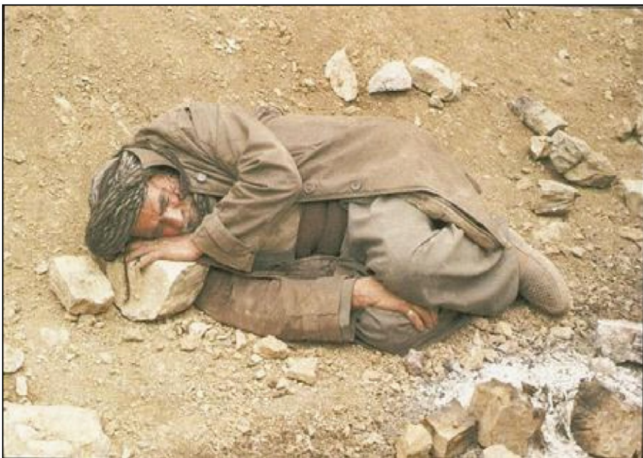
دادگه‌ها بلندا تاوانین عراقی کیشا کوردین فهیلی ب جینۆساید دا نیاسین.