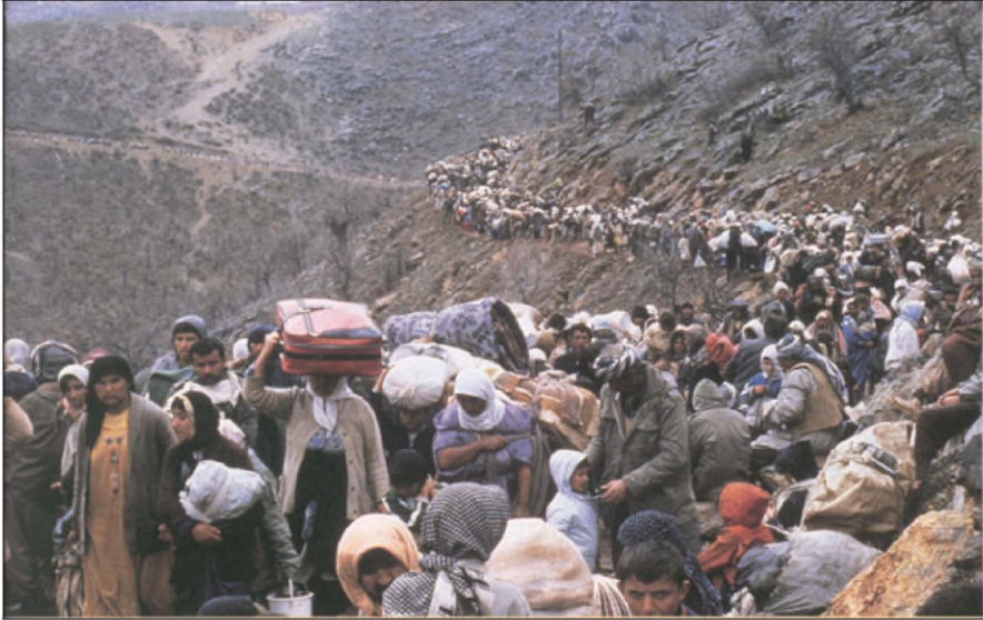
مشەختبوونا کوردان ل سالآ ١٩٩١ز

چونکی ئەف سەرهلدانە دیرووکی هەمی ئەو دەفەر ژێ قەگرتن، کو بەعسی ئەو دەهان سال بوون مژیلێ نەهیلانا مۆرا نەتەوهیی یێ کوردان بوون.