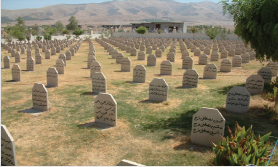
گورستانا ب كۆم يا كىميا بارانا ھەلەبچە

رېكەفتنامىدا سۆزەك و ئىمزاكرىه، كو گونەھبارىن جىنۇسایدئ ژى بدەنە دەستئ وەلاتىن وان.