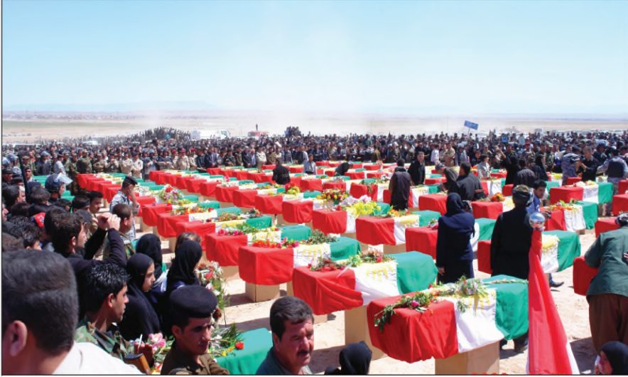
(رێبۆرەسمین دووبارە فەشارتنە ئەنفالكریئ گەرمیان)

سەروكاتیا وئ دەهاتە كرن. هێرش و بەلامارین ئەنفالی ژ لایئ هیزین نیزامی و هەردوو فەیلەقین ئێك و پینج هاتنە ئەنجامدان ب پشتهفانیا یەكین جوداجودا یین سوپایئ عیراقئ و فەوجین سقكین كوردان (جاشی).