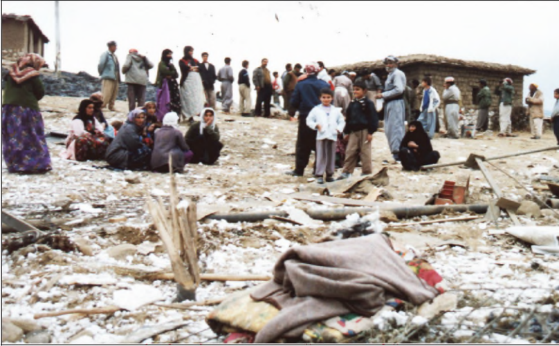
خۆ بهر مه فکرنه بۆ مشه ختبونۆی پشته ئه نفالۆ

ئهو په نابه رین کۆ به رهف تورکیا ره فین، ده ستیکی حکومه تا تورکیا رازی نه بوو ب حه وینیت. ئه وین ژ سنووری تورکیا ژی دهر باز بووین هنده ک ژ وان دانه دهستی حکومه تا عیراقی، ریک نه دانه ریک خراوین مروقی و رۆژنامه نفیسان سه را وان بدهن، دا بۆ وان ناشکرا بیت، ئه ری چه کی کیمیاوی دژی وان بکاره اتیه یان نه. ل مه ها سالآ ۱۹۸۹ (۳۰۳۴) سیه هزار و سیه - و چوار کهس ل ئوردو گایه کی تورکی، ب ئه گه ری نانی ژه راوی بوون ئه ف کاره ژی ب هه فپشکی دناقهه را زه لامین رژیما عیراقی و کار به ده ستین تورکیا هاتبوو ئه نجامدان.