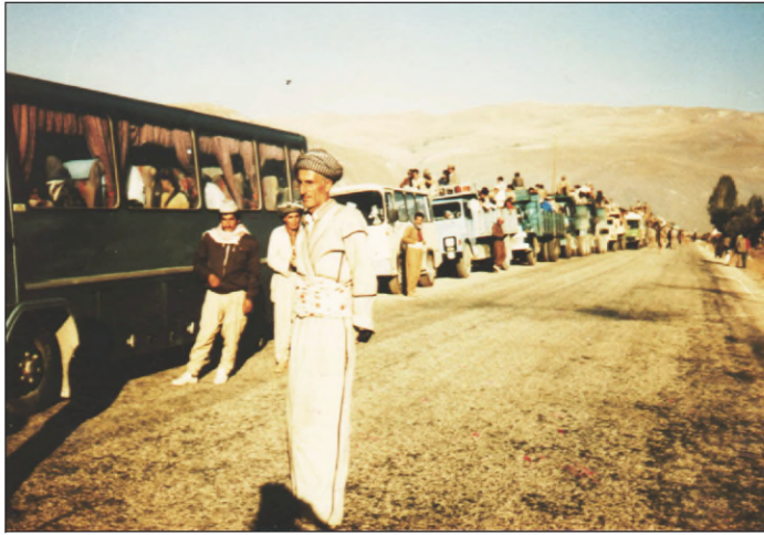
پشتی ئه نفالای به رەف ئیرانی دچن

ئەنفالا دوماهیی یا (بەهیدینان) ب دوو ساخلەتین ژ هەوین دی دەیتە جوداکرن (دەقەرین قەرەداغ و گەرمیان و ئافزیلا زیی بچویک و دۆلا شەقلاوا و رەواندوز) ئ ژبەر چەند ئەگەرەکا: