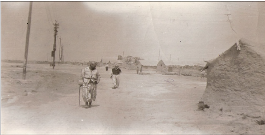
کۆمەلگەھا بارزانیان ل قوشتەپە، دوبر ژ پیدقیین ژیانئ

نەتەوھەیی عەرەبدا، لەورا رۆژ بۆ رۆژی ھێرشین وان ب توندتر بوون و قوربانی و پیشیلکرنا مافین مروۆفی ژى زیدەتر دبوون. بارزانی ژ فان ھێرشان پشکا شیرى بەرکەفتبوو، چەندین جارا ژ واری باب و باپیران ھاتنە راگواستن و تالانکرن. ھەر ل دەستپیکا سیهین سەدی رابردوو کەفتنە بەر ھێرشا لەشکەرئ پیادەیی عیراقتی و ب پشتمانیا فروکین جەنگی یین ئینگلیزی چەندین گوند ویرانکرن و ئاکنجیین وان بەرەف تورکیا رەفین.