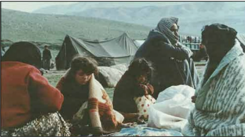
كوردین فهیلی ل خيفه تگه مین سه ر سنوورى ئيراني

كيشا كوردین فهیلی وهك كيشا عه ره بپن شيعه يا گريد ايبوو ب وئ مملانا سياسيا دوير و دريژ دناقبه را هه ردوو دهوله تين ئوسمانی تورك و سه فهري ئيراني، كو ريخوشكه ربوو بو دابه شكرنا ئاكنجيين دهه رى دناقبه را دويفكه فتيين ئيراني و ئوسمانيا. گه لهك ژ شيعين عيراقى ب دويفكه فتيين ئيراني هاتنه توماركن كول ناقه ندا كوردین فهیلی بوون ل دهستپيكا دامه زانندا دهوله تا عيراقى رويبى جودا كرنى بووينه دگه ل تهخ و چيپن دى يين جفاكى عيراقى.