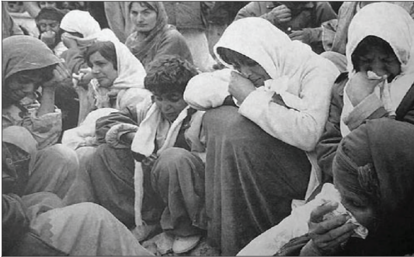
(کۆمکرنا ژن و زارۆکی کورد د ھەوین ئەنفالییدا و رەوانە کرنا وان بەرەف مرنی)

شەش: تیکچوونا بارودۆخین کوردان، کورد دق قۆناغیدا زۆر دبی کەس بوون، چ ھیز و ولاتەک نەبوو پشەقانی و داکوکی ل مافین وی بکەت و گفاشتنی بیخیتە سەر حکومەتا عیرقی بەرامبەر ھەمی پیشیلکاریین نەمرۆقانەیی کو پەیرەو دکر دق کرنا رەگەزی دژی گەلی کورد، ب تایبەتی ل سال ۱۹۸۸ کو ھەمی دەقەرین کوردستان قەگرت.