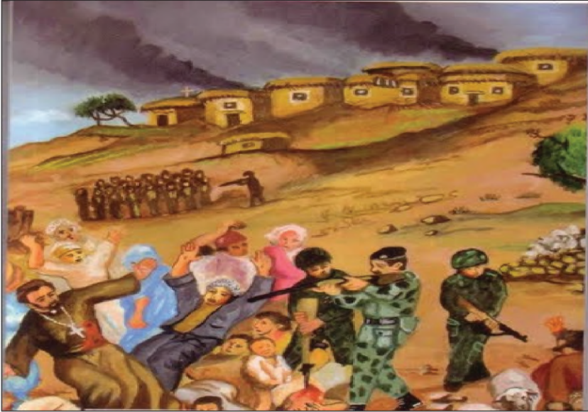
گوللہ بارانکرنا (٦٠) کەسان ژ ئالیی گوندی (صوریا)

هەر چه‌نده هه‌یفا ئاداری ساڵا (١٩٧٠) ریکه‌فتناما ئاداری دناقبه‌را بزافا کوردی و حکومه‌تا عیراقی هاته ئیمزاکرن کو دان پیدان بوو ب مافی ئوتۆنۆمی بو گه‌لی کوردا ل هه‌ریما کوردستانی. به‌لی ژ به‌ر راگه‌هاندنا یاسایا ئوتۆنۆمی ژماره (٣) ١٩٧٤، حکومه‌تی به‌ز ده‌ست بجه‌ ئینانا سیاسه‌تا عه‌ره‌بکرن و راگواستنا ئاکنجیین ده‌قه‌رین که‌رکوک، خانه‌قین، ژمار، سنگال، شیخان کر، ل ساڵا (١٩٧١ - ١٩٧٢) پتر ژ (٤٠٠٠٠) هزار کوردین فه‌یلی ناسناما وه‌لاتیبوونی یا عیراقی ژئ هاته ستاندن و ره‌وانه‌ی سنوورین ئیرانی کرن ئەف ژمارا کوردین ده‌رئێخستی هه‌تا دوماهی یا (١٩٨٠) گه‌هسته‌ نزیکی (٢١٥٠٠٠) دووسه‌د و پازده‌ هزار که‌س. لدویف ئامارین خاچا سۆرا تیف ده‌وله‌تی دبنه‌ نیزیکی (٤٠٠٠٠٠) چار سه‌د هزار وه‌لاتی ل ساڵا (١٩٧٣)