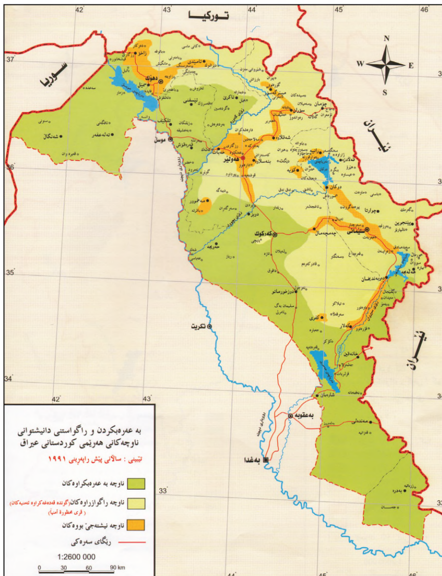
نه‌خشی ژماره (۱) عه‌ره ب کرن و پراگوستنا ئانکنجیی کورد ژ ههریما کوردستانی *

* ژ نه‌خشی سهردار محمد عبدالرحمن / ئه‌تله‌سا ههریما کوردستانا عراقی.